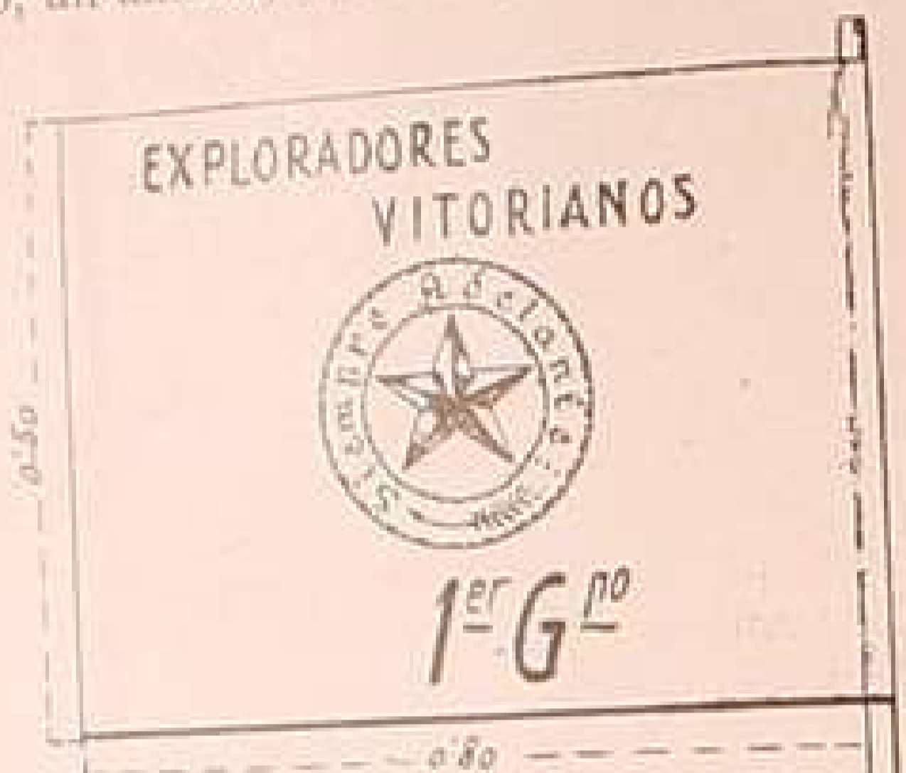
Figura quinta.—Bandera de grupo

Los Exploradores. —Tienen cada uno un número de orden correspondiendo el núm. 1 al jefe de patrulla.