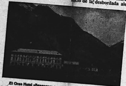
El Gran Hotel Benasque convertido hoy en Colonia Escolar.

Al médico, que, agobiado de trabajo, ha cuidado de los niños enfermos con igual interés que si fuesen hijos suyos.