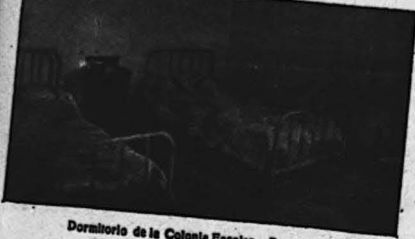
Dormitorio de la Colonia Escolar.—Benasque.