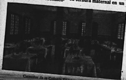
Comedor de la Colonia Escolar.—Benasque.

dados, van comprobando las características de verdadero paraíso en que viven sus hijos; van contemplando emocionadas los impecables lechos en que ellos sueñan con un luminoso porvenir, el ordenado co-