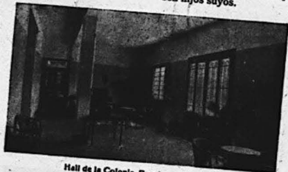
Hall de la Colonia Escolar.—Benasque.

de las más palmarias demostraciones de la eficacia de los desvelos con que la Delegación de Colonias Escolares de Aragón trata de sustituir a los niños residentes en zonas de guerra de los peligros—morales y físicos—propios de las mismas.