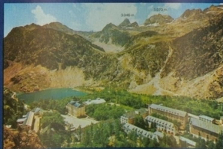
Vista general del Balneario de Panticosa. Al fondo, Macizo del Arguals y Garmo Negro.