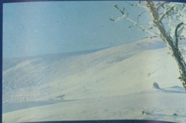
Balneario de Panticosa. Pistas de nieve.