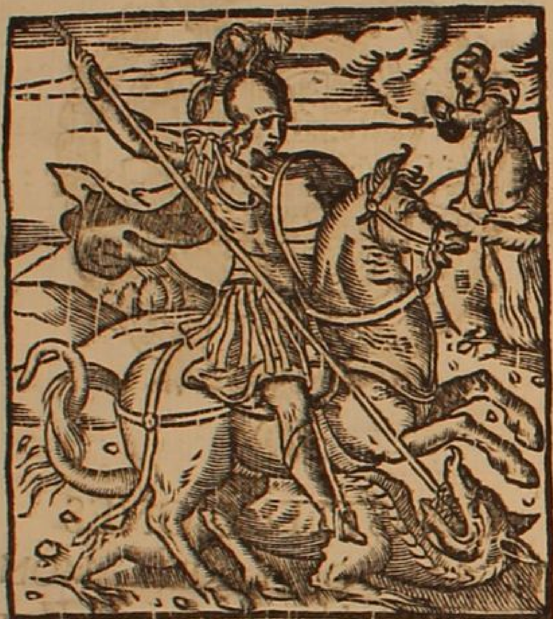
SAN JORGE, MARTYR, Patron de el Reyno de Aragon, y de el Real Monte de Piedad.