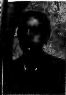
Comandante Miguel Lasso Lasso, gobernador de la zona de los alrededores de nuestro Ejército en el Sector de Delbata.