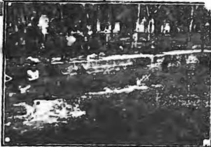
abajo. «NOTICIERO UNIVERSAL»