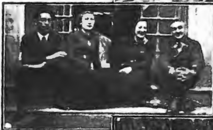
EN EL CENTRO. Los maestros de la Colonia.