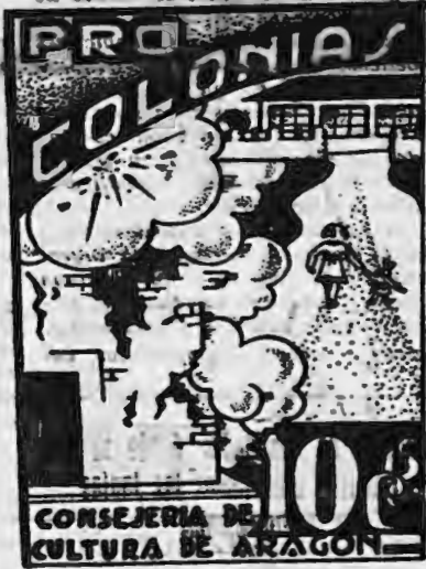
En las Jornadas Escolares Antifascistas, el sello pro-Colonias—su divulgación— ha de tener un puesto esencialísimo.

Nuestras escuelas necesitan una orientación, un contenido que encauce a las nuevas generaciones. No basta mirar superficialmente por un maestro retribuido y un local, una escuela perfectamente dotada. Hay que mirar al contenido interno, a la doctrina, a la disciplina que nos impulsa en nuestras realizaciones. Y esto es lo que quiere el Ministerio y la Consejería de Cultura. El caso de Lombardía, en la reunión de Valencia así lo demostró a los directivos de las escuelas de nuestra Federación. Y la Consejería de Cultura en colaboración con la Federación Aragonesa de Trabajo y la Enseñanza ha dado el primer paso fijando normas para la realización de las Jornadas Escolares Antifascistas.