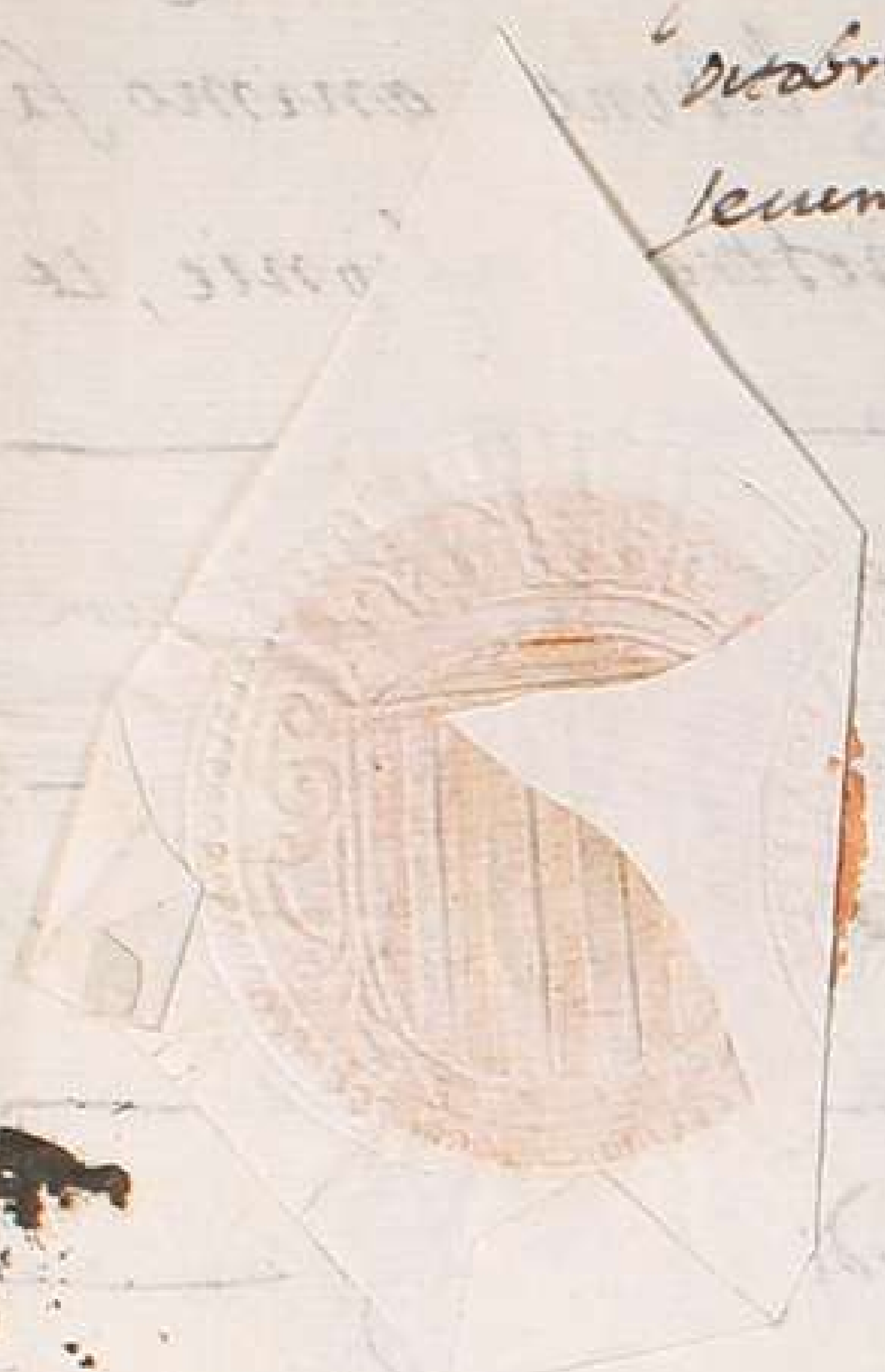
figura. In quorum testimonium presentem sigillo regio porus apponi solito in legalitacionibus instrumentorū in posse meo existenti muniti. Provenona festivo die mensis octavii anno a Nat. Domini Millesimo sexcentis sexagesimo secundo. 2

Alfonso Rey por la Pr. y Comenda de Sicilia a los de suex Lam. de la Laguna, a los condes de Castillano