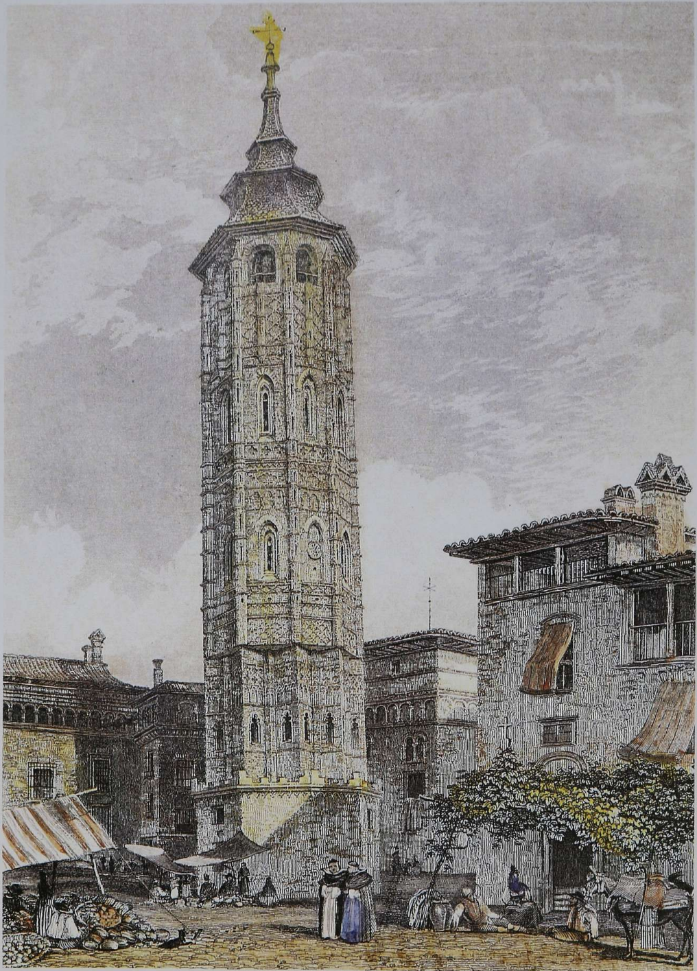
The Leaning tower of Saragoza