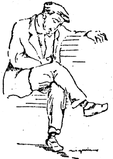
No puedo haber tranquilidad en España mientras exista un millón de parados. Exigimos del Gobierno actual la inmediata adopción de medidas que solucionen este pavoroso problema.

VIDA NUEVA saluda a los camaradas que hoy salen de la cárcel. Al fin se hizo justicia.